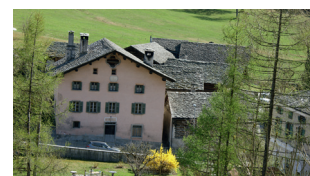
La maison d'habitation de la famille Giacometti

Les extraits qui apparaissent dans le film ne sont qu'une petite partie de ces merveilleux récits. Toutes les conversations sont conservées et constituent de précieux documents d'époque. J'ai pu étayer la vie familiale intérieure des Giacometti par des citations tirées de leurs nombreuses lettres et leurs textes. Leurs dessins, esquisses et peintures sont également un formidable trésor qui nous permet de voir l'intérieur des rapports familiaux. Aujourd'hui, on parlerait de selfies. Après dix ans de travail, j'ai été très heureux de pouvoir fêter la première mondiale lors des Journées de Soleure 2023 et de pouvoir raconter l'histoire de cette famille extraordinaire.